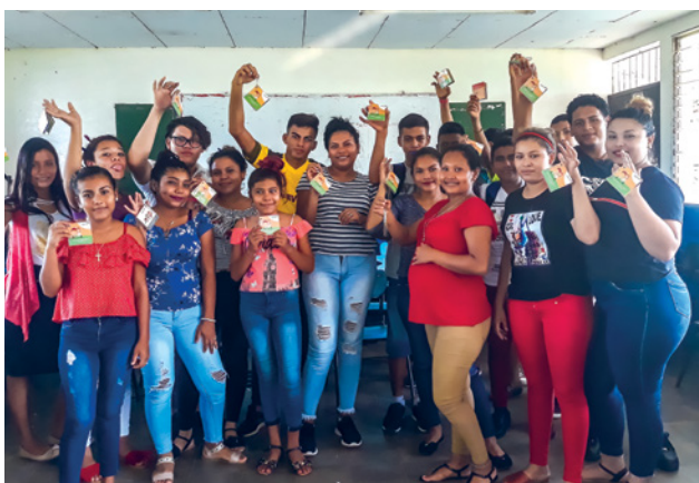
Teenager befassen sich im Kinderclub mit Themen wie Selbstschutz, sicherer Umgang mit Social Media und Mobbing. Mit diesen Büchlein können sie ihr Wissen leicht anderen vermitteln.